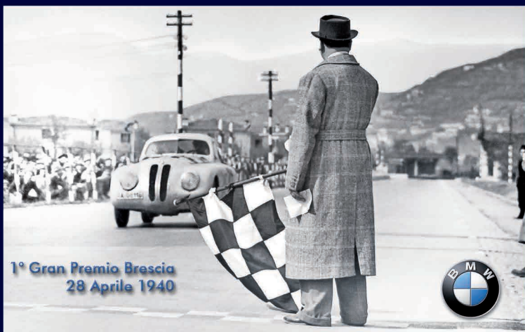
1° Gran Premio Brescia 28 Aprile 1940